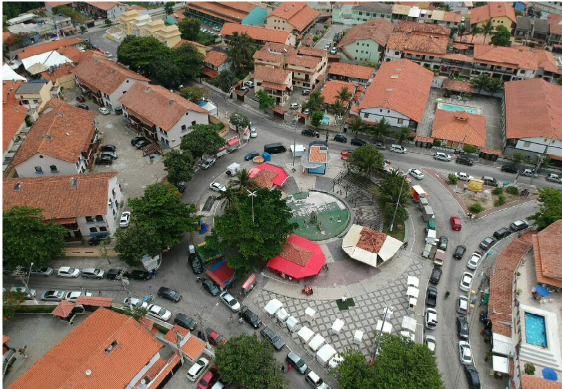
Praça do Moinho, no Perú, precisa de obras de revitalização

população. “É na união de lideranças que transformamos demandas isoladas em